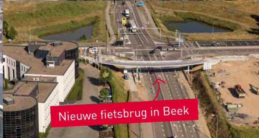
Nieuwe fietsbrug in Beek